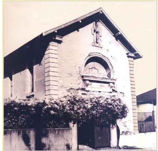
le temple (en 1970)